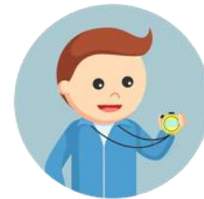
2 (DOIS) PROFESSORES DE EDUCAÇÃO FÍSICA