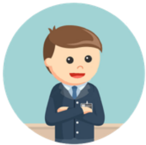
1 (UM) SUPERVISOR ESPORTIVO

As atividades serão desenvolvidas em dois núcleos na cidade de Porto Alegre. Ao todo serão 06 (seis) turmas de 20 alunas cada, totalizando 120 meninas dos 10 aos 17 anos, que terão atividades duas vezes por semana.