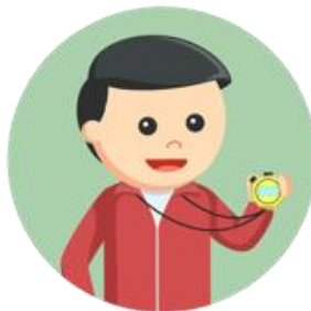
1 (UM) COORDENADOR TÉCNICO