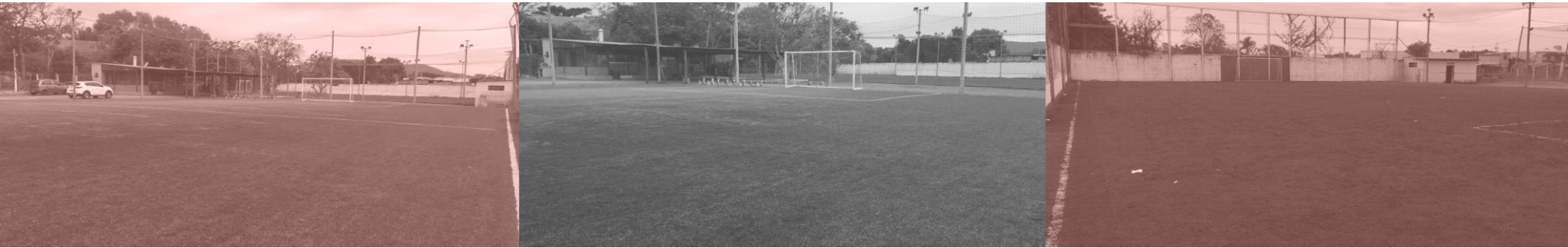
NÚCLEO JARDIM PLANALTO