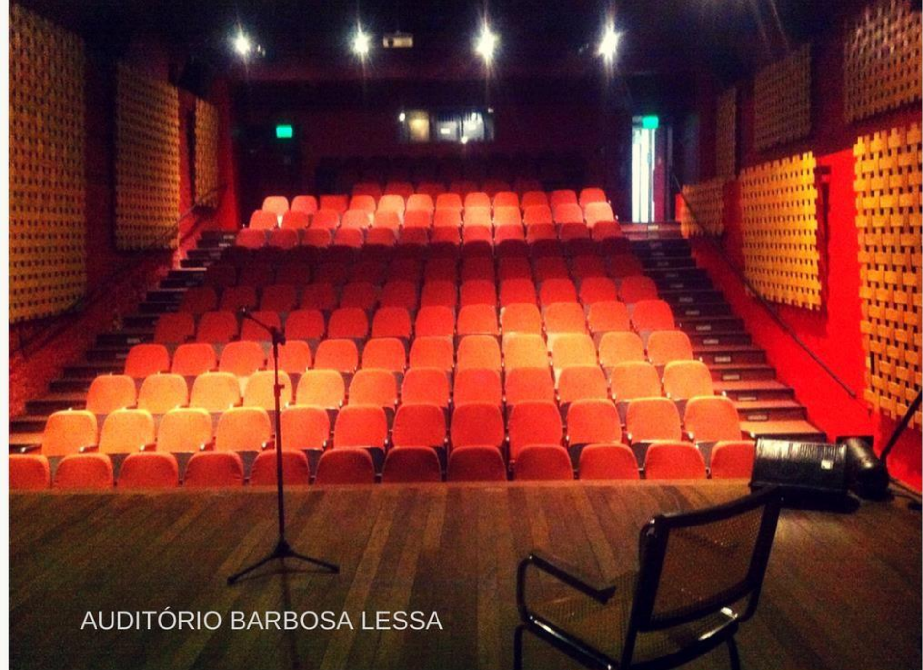
AUDITÓRIO BARBOSA LESSA